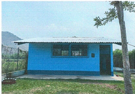
Foto1: Finalización de modificación de techo pintura y balcones modulo 3 (uso prepa).