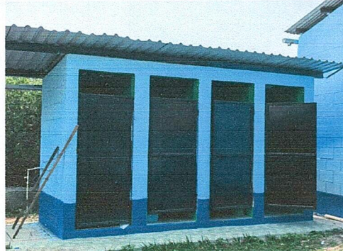
Foto 2: Finalización de modificación servicio sanitario, pintura interior y exterior, techo, puertas, piso