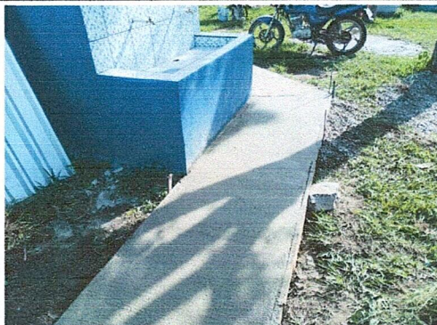
Foto 4: Finalización del abastecimiento de agua, azulejado para evitar inundación y banqueta adicional